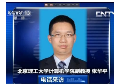
2018年10月4日，中央电视台就FB5000万账户信息泄露事件采访张华平教授。